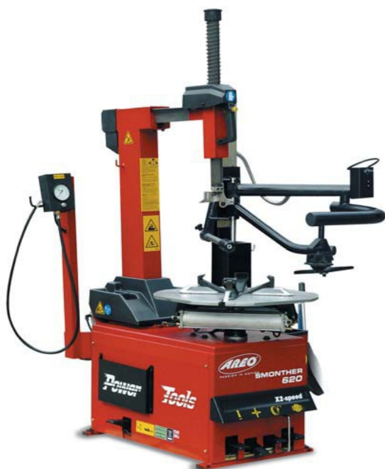
SMONTHER 620-2 & HELPER